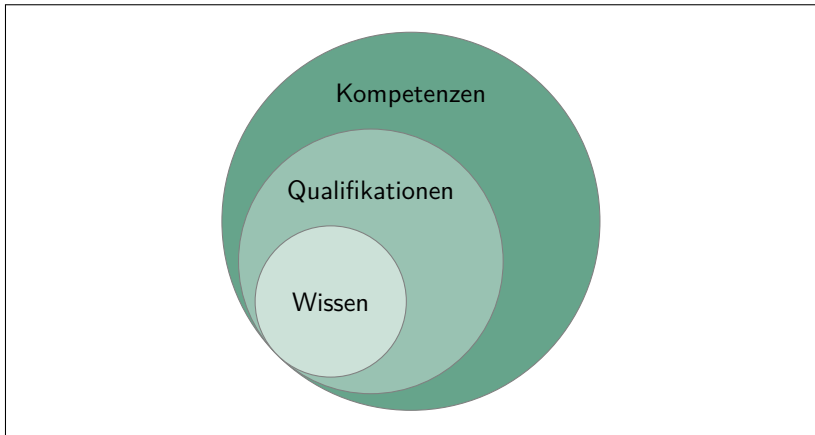
Abbildung 1: Lernergebnisse in Anlehnung Erpenbeck/Heyse (2007)

wird. Nach erfolgreicher Anerkennung können diese außerhochschulischen Vorleistungen dann für die Anrechnung auf Studieninhalte genutzt werden (vgl. Hanak/Sturm 2013, S. 9).